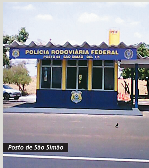
Posto de São Simão