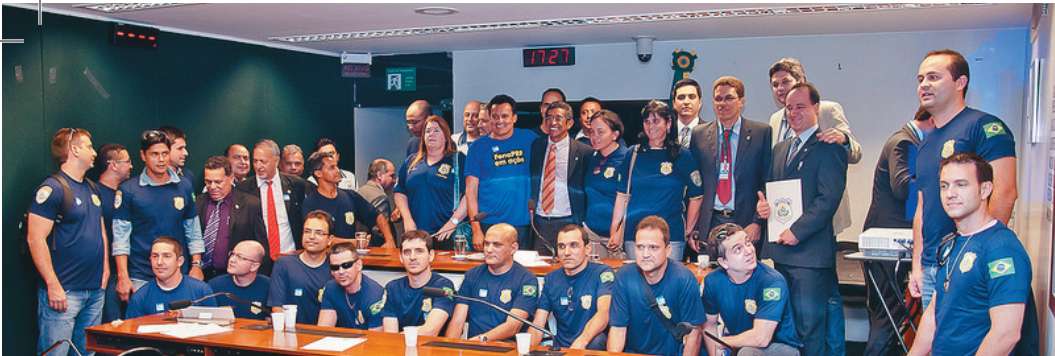
Caravana de PRFs lota o Plenário para audiência