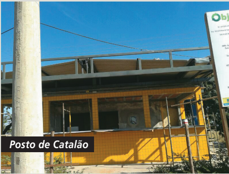
Posto de Catalão