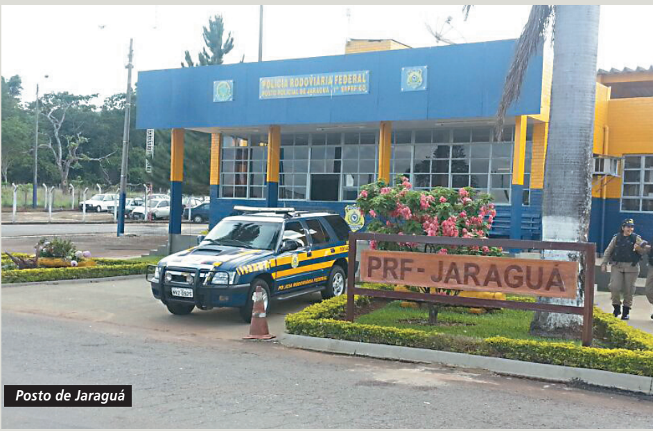
Posto de Jaraguá