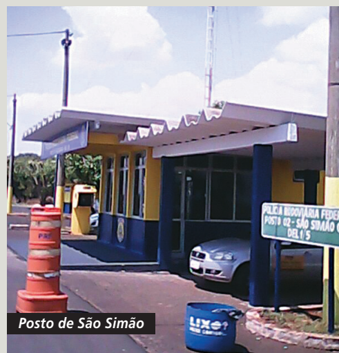
Posto de São Simão

Em relação aos três postos que ainda não foram reformados – Guapó, Uruaçu e Porangatu – no primeiro, as obras estão prestes a iniciar e para os dois últimos falta o processo licitatório ser realizado.