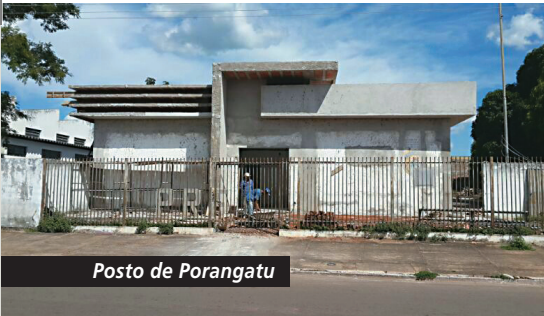
Posto de Porangatu