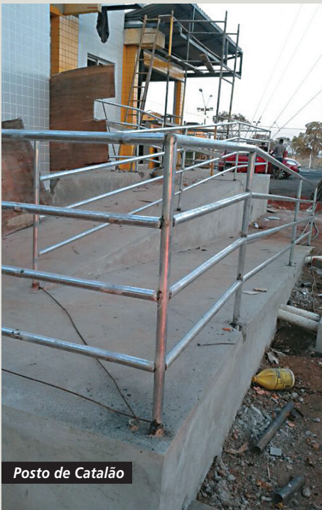
Posto de Catalão