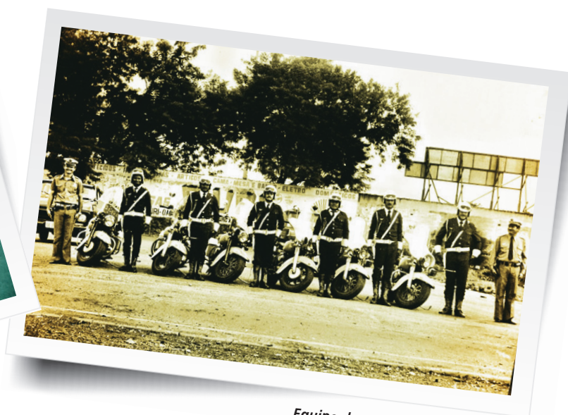
Equipe de patrulheiros da PRF