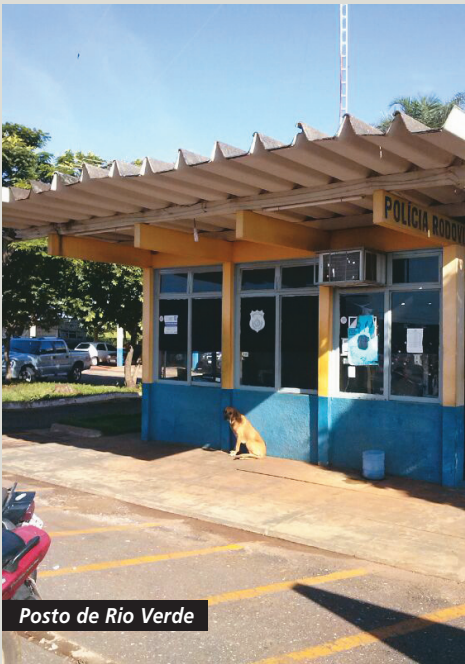
Posto de Rio Verde