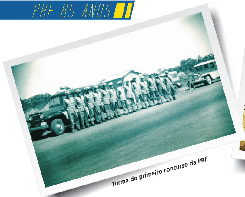
Turma do primeiro concurso da PRF