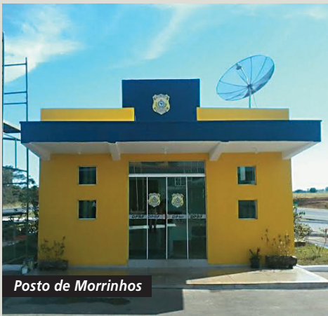
Posto de Morrinhos